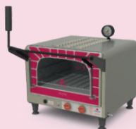
FORNO REFRATÁRIO MINI CHEF PRP-400 STYLE G2