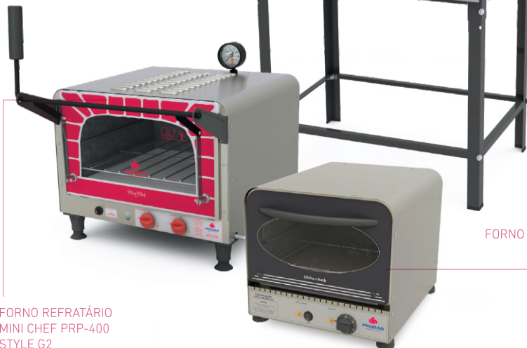
FORNO REFRATÁRIO LITTLE CHEF PRPE-200