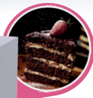
FORNO REFRATÁRIO PRP-860 G S/KG