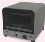
FORNO REFRATÁRIO LITTLE CHEF PRPE-200