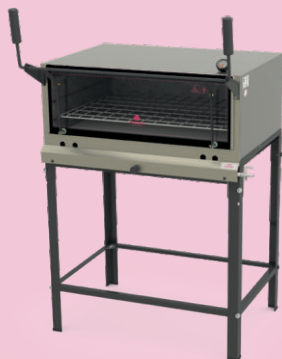
FORNO REFRATÁRIO PRP-860 G S/KG