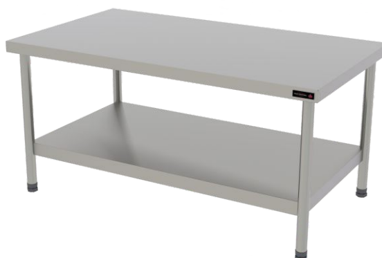
PRO CAVALETE 120