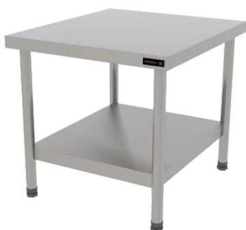
PRO CAVALETE 60