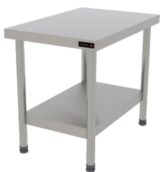
PRO CAVALETE 45